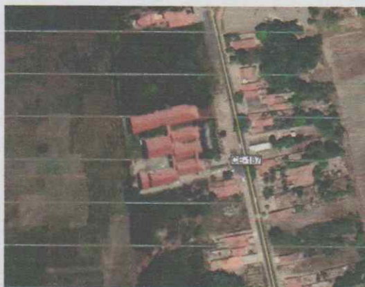
Imagem 1 – Localização do Hospital Municipal.

O Hospital Municipal Dr. Bueno Banhos está situado na CE 187 sentido Ibiapina, atendendo a toda a cidade em cirurgias, consultas e exames. É composto por quatro salas de cirurgias, diversos leitos de internação e salas para consultas.