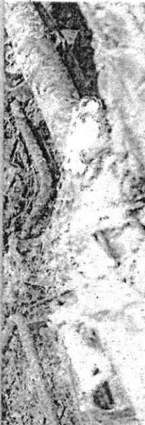
MEMBROS de facções têm semeado terror na onda de ataques

"Nós vamos continuar com os policiais nas ruas não só com as chamadas barreiras itinerantes, mas com as barreiras permanentes, ao mesmo tempo que iremos aprofundar os processos de apuração e de investigação em curso. Está havendo uma diminuição das ocorrências, portanto, é o momento para a gente intensificar essas medidas", declarou a governadora Fátima Bezerra (PT) (Agência Estado)