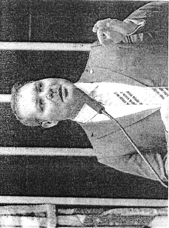
PABLO VALLADARES/CÂMARA DOS DEPUTADOS

ARTICULAÇÃO | Deputados reclamam de atendimento a bolsonaristas e "concentração" de cargos com líder petista