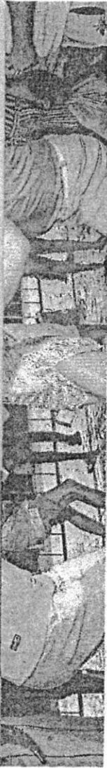
ANIMAÇÃO de foliões no Pré-Carnaval da avenida Beira Mar, neste domingo