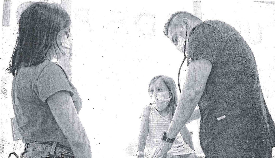
ELLA | aviação de 4 anos, foi atendida no I

Estado do Ceará - Prefeitura Municipal de São Benedito - Extrato de Edital de Pregão Eletrônico Nº 90006/2024-PE - Processo Administrativo Nº 2024.03.20.01. O(s) Órgão(s) Solicitante(s), exercendo suas atribuições Legais e em conformidade com a Lei Federal nº 14.133/2021 e o Decreto Municipal Nº 54/2023, informam aos interessados que realizarão através do Pregoeiro Oficial do Município uma Licitação na modalidade de Pregão Eletrônico (Dia 16/04/2024 às 10h (horário de Brasília)). O objeto é a Aquisição de hortifrutgranjeiros para atender a demanda das diversas Secretarias do Município de São Benedito/CE. As condições, quantidades e exigências estão estabelecidas no Edital e seus Anexos, que podem ser acessados no site https://pncp.gov.br/app/editais . São Benedito/CE, 01 de abril de 2024. Luís Carlos do Nascimento - Secretário de Saúde